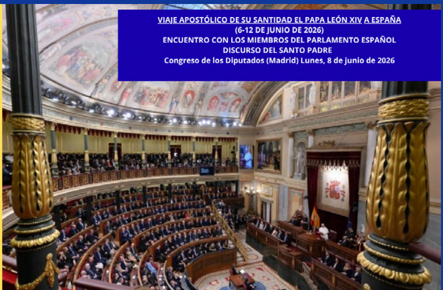
VIAJE APOSTÓLICO DE SU SANTIDAD EL PAPA LEÓN XIV A ESPAÑA (6-12 DE JUNIO DE 2026) ENCUENTRO CON LOS MIEMBROS DEL PARLAMENTO ESPAÑOL DISCURSO DEL SANTO PADRE Congreso de los Diputados (Madrid) Lunes, 8 de junio de 2026

“La familia será siempre la primera escuela de humanidad en la que se aprende, antes que en cualquier otro lugar, la gramática elemental de la convivencia: recibir la vida, cuidar al otro, perdonar, servir y pertenecer”