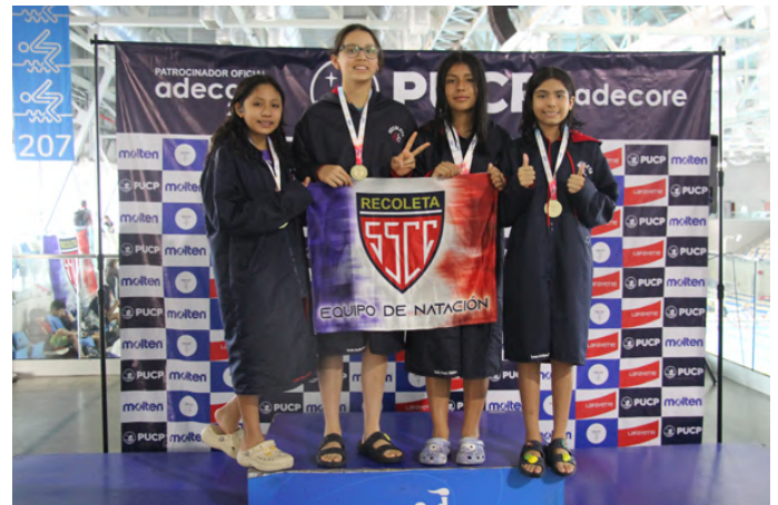
Infantil A Damas MEDALLA DE ORO POSTA 4 X 50 LIBRE