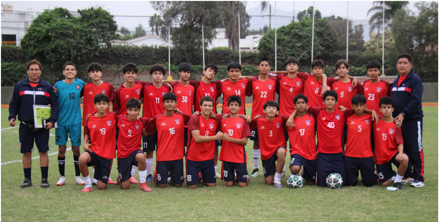
SELECCIÓN DE FÚTBOL VARONES MEDIANOS - ADECORE 2026