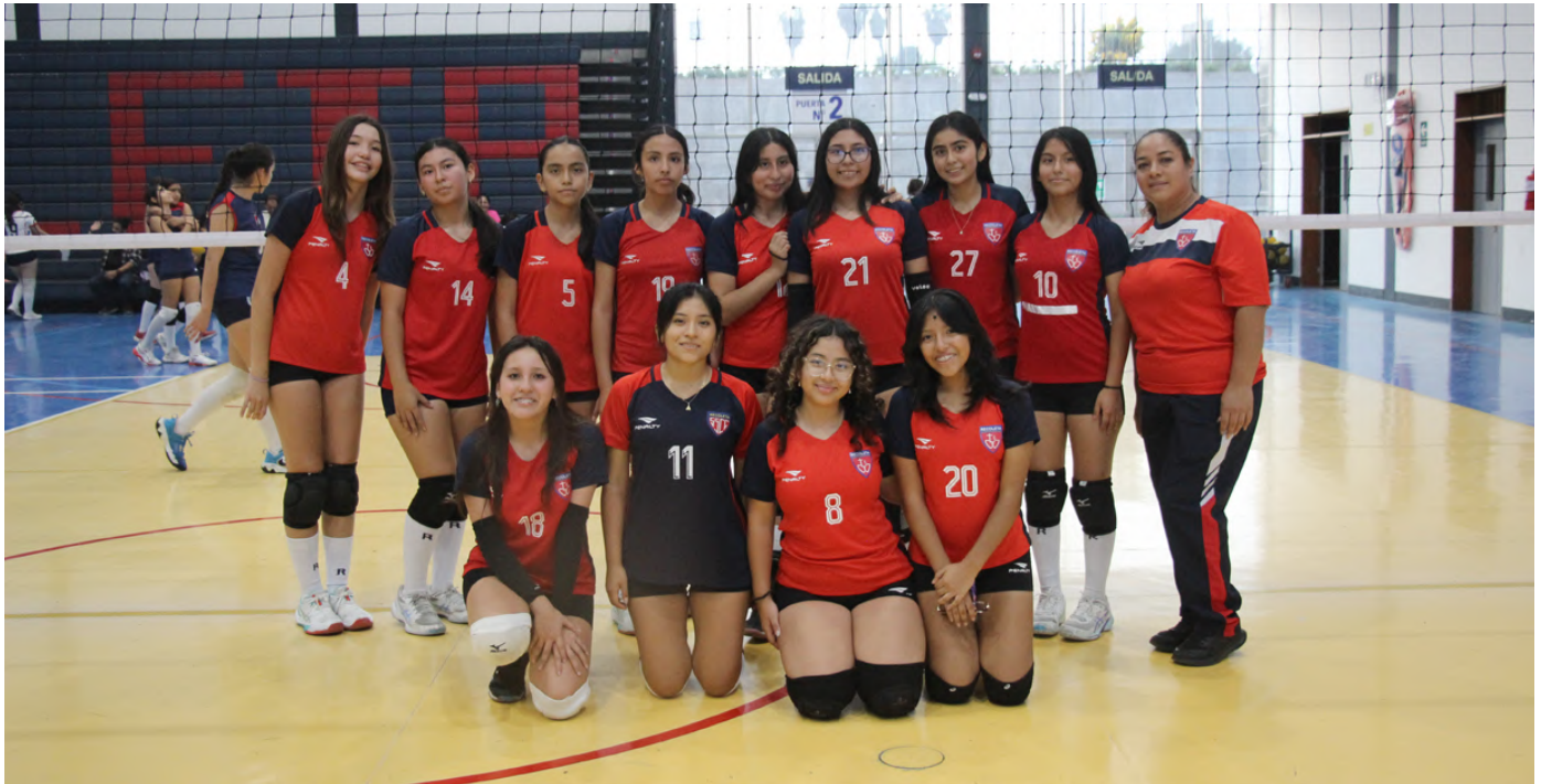
SELECCIÓN DE VÓLEY DAMAS MAYORES - ADECORE 2026