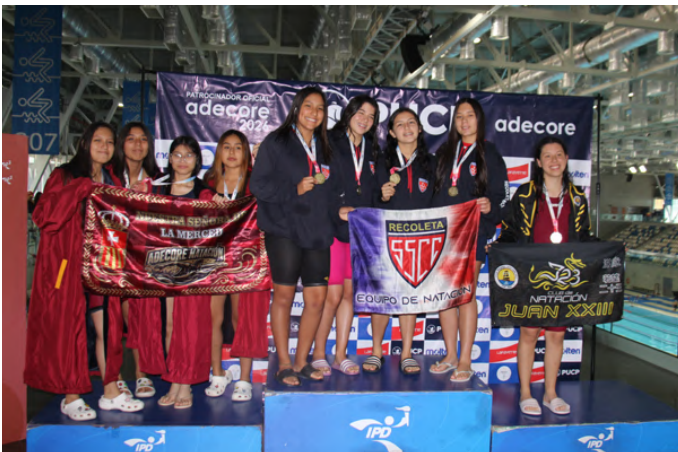
Juvenil B Damas MEDALLA DE ORO POSTA 4 X 50 LIBRE