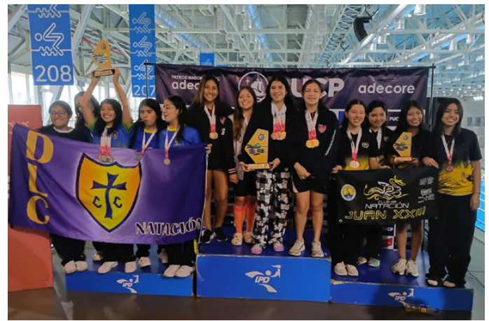
Campeonas Categoría Juvenil B Damas

Haz clic aquí en el enlace para ver más fotos: