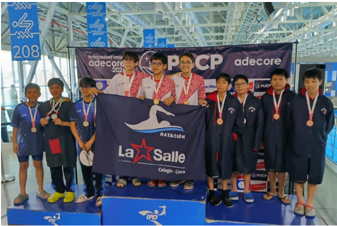
Posta 4 X 50 m. libre Infantil B Varones MEDALLA DE BRONCE