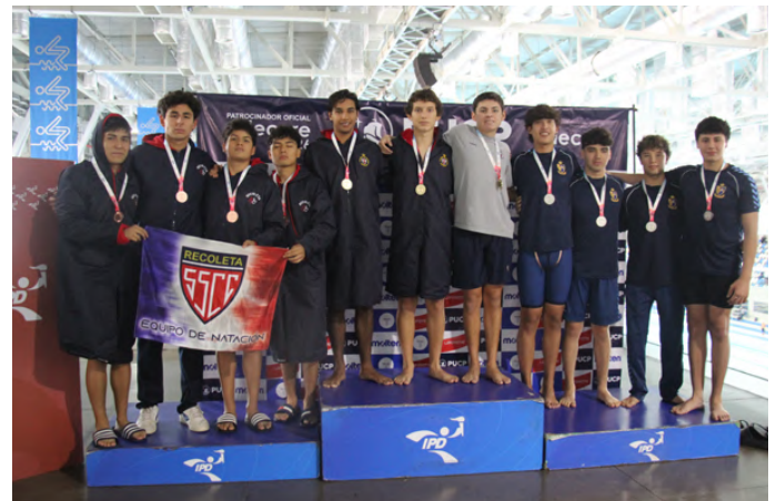
Juvenil B Varones MEDALLA DE BRONCE POSTA 4 X 50 LIBRE