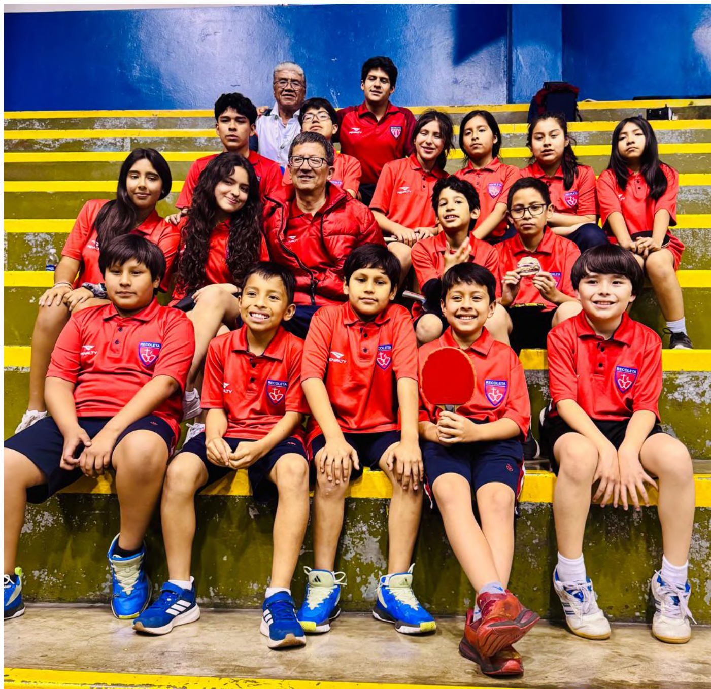
SELECCIÓN DE TENIS DE MESA - ADECORE 2025

Les deseamos muchos éxitos y los felicitamos por defender con orgullo nuestros colores. Este sábado 27 de septiembre en la tarde concluye el torneo. ¡Vamos Reco!