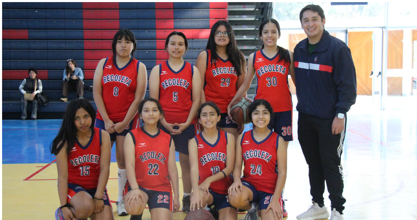
SELECCIÓN DE BÁSQUET DAMAS MEDIANAS - ADECORE 2025