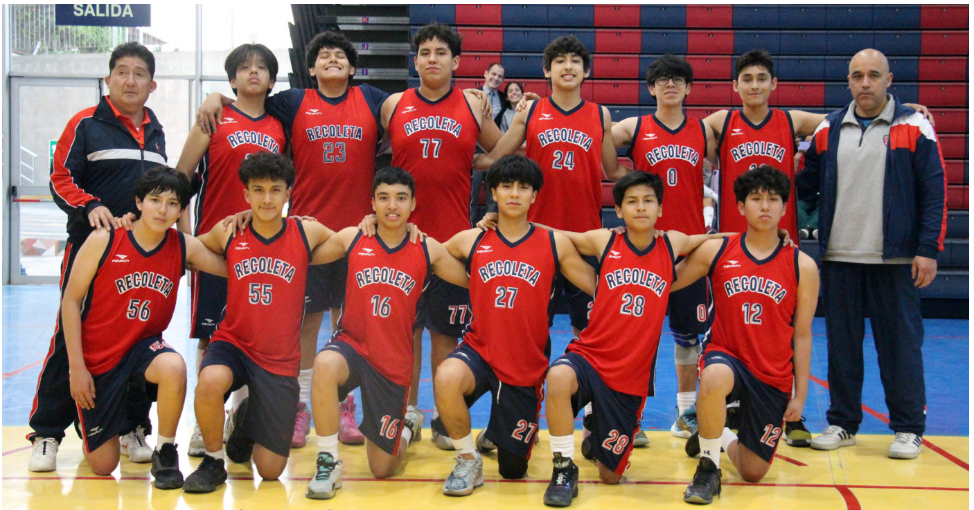
SELECCIÓN DE BÁSQUET VARONES MEDIANOS - ADECORE 2025